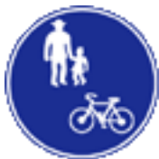
自転車及び歩行者専用標識

1978年の道路交通法改正で「通行可」と表示された歩道なら自転車が走行を許されるようになりました。交通事故の急増で自転車を「交通弱者」と見なした救済措置だったのです。もともと条件付きで許していただけなのに、それがいつのまにか自転車は歩道を走るものという誤解が一般化したようです。